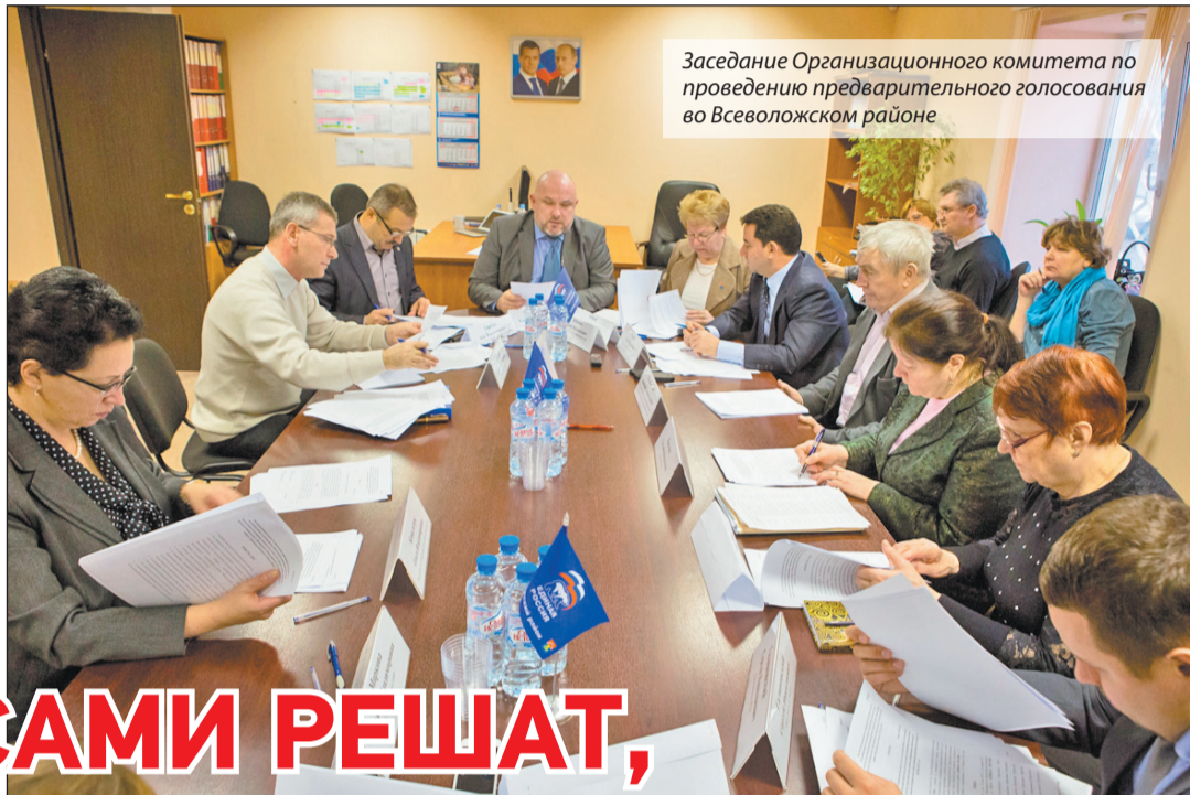
Заседание Организационного комитета по проведению предварительного голосования во Всеволожском районе

18 мая 2014 года Всеволожское местное отделение партии «ЕДИНАЯ РОССИЯ» проведет внутрипартийное предварительное голосование (праймериз). Победители предварительного голосования получат право баллотироваться в депутаты на сентябрьских выборах местных советов. Предварительные и официальные выборы пройдут в 15 муниципальных образованиях района: в Сертоловском, Всеволожском, Токсовском, Дубровском, Рахинском и Морозовском городских поселениях, в Бугровском, Куйвозовском, Лесковском, Муринском, Свердловском, Романовском, Щегловском, Заневском и Юнковском сельских поселениях.